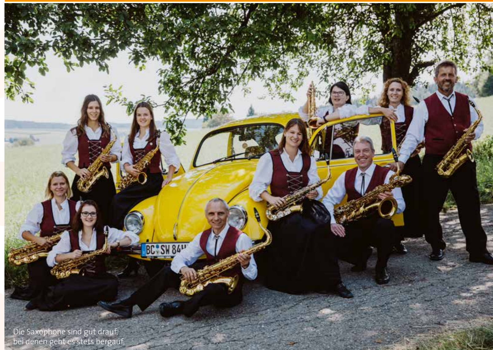
Die Saxophone sind gut drauf, bei denen geht es stets bergauf.