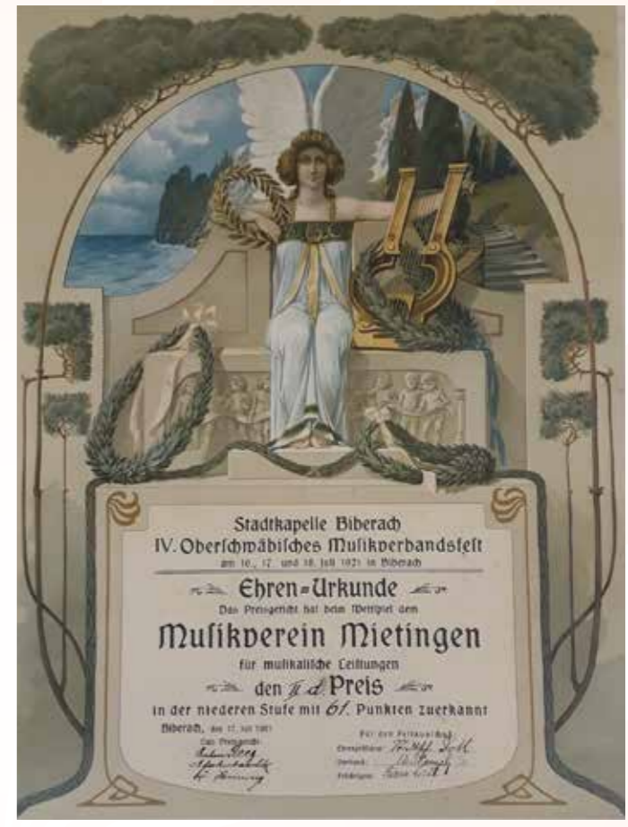
Ehren-Urkunde zur Teilnahme am Wettspiel in Biberach aus dem Jahr 1921

Aber nicht nur das musizieren, auch das Theater spielen wurde im Musikverein gepflegt. Im Jahr 1927 wurde die Anschaffung einer Theaterbühne gemeinsam mit dem Gesangverein beschlossen. Zur Finanzierung wurde eine Anleihe ausgegeben. Jedes Vereinsmitglied musste hierzu fünf Reichsmark aufbringen.